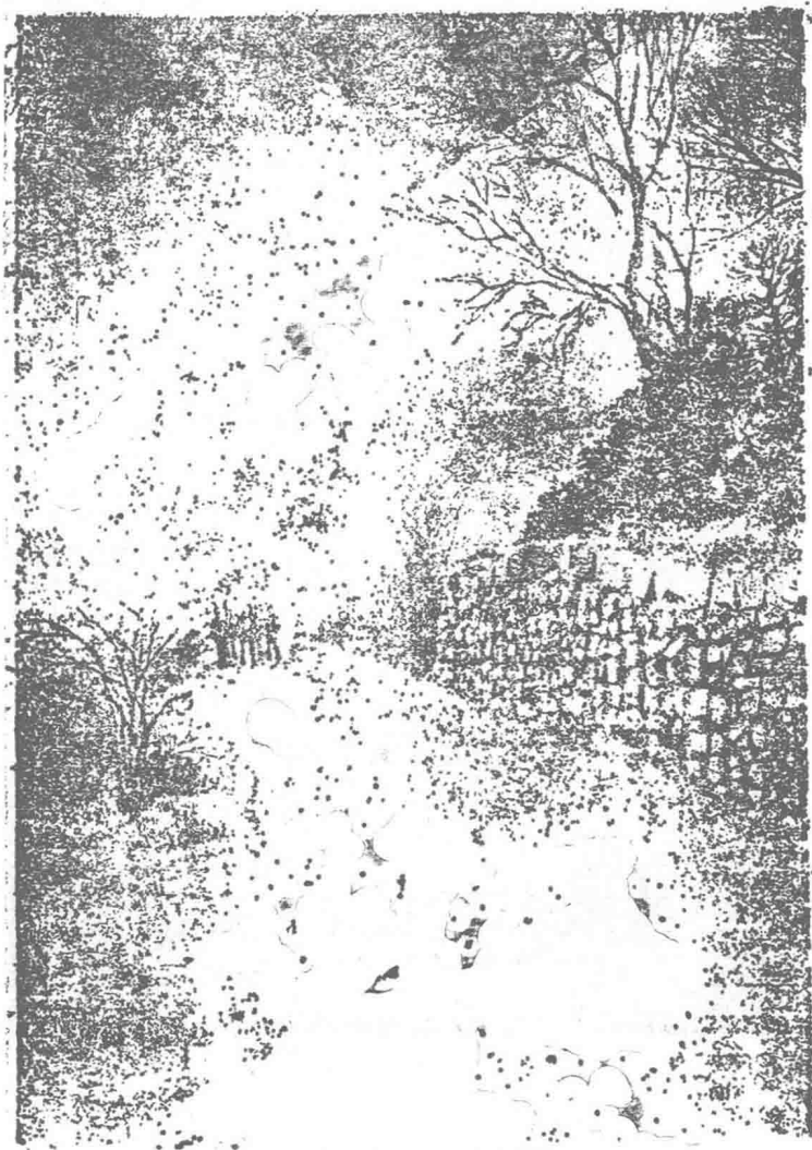
《古戍寒笳记》初版封面