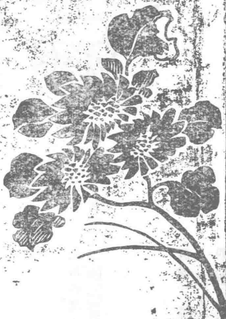
《如此京華》初版封面