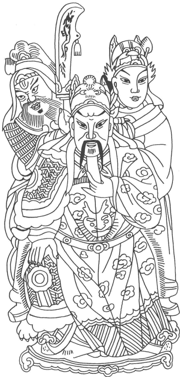
山东潍坊杨家埠年画 关公像

压岁钱，一般装在红包里，红色象征好运、活力和愉快。压岁钱是每年春节长辈送给晚辈的礼钱。因“岁”与“祟”谐音，压岁钱的寓意就是压住邪祟，压岁钱寄托