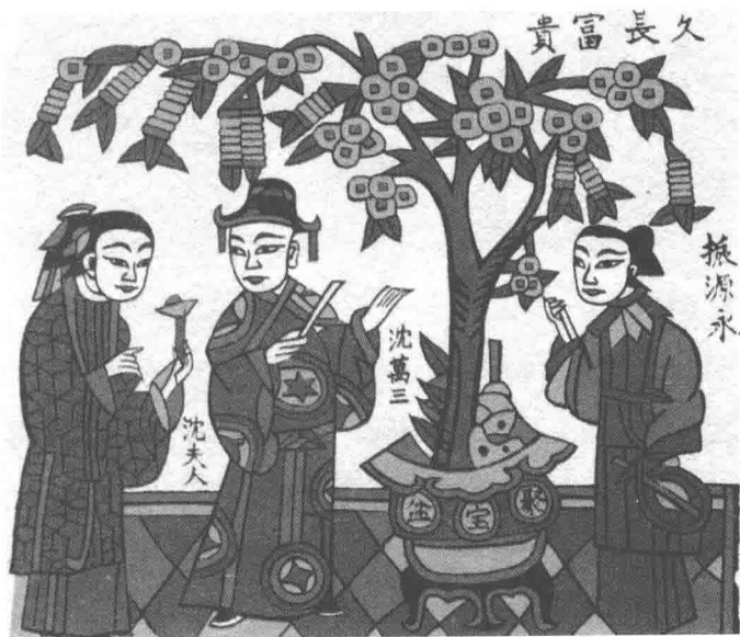
河南朱仙镇年画 富贵长久

现实生活中，“财”有着重要的地位和作用，财富的概念范畴由原来物质的、生活的层面，拓展到了心理的、信仰的层面。究其原因，主要在于人们的社会生活离不开钱财，就连最基本的生