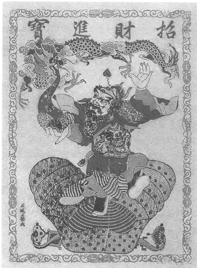
江苏苏州桃花坞年画 招财进宝