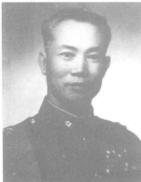
深为蒋介石器重的陈诚