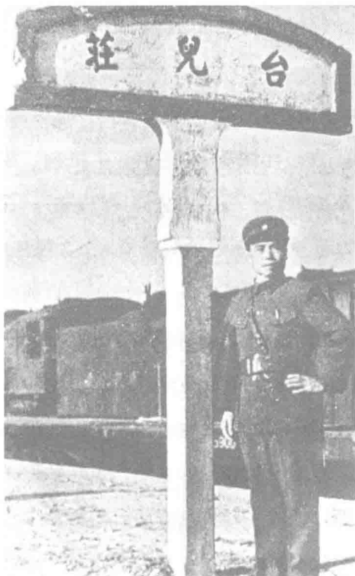
负责指挥台儿庄战役的李宗仁在被夺回的台儿庄火车站留影。

林蔚是他的侍从室主任，机巧，善解人意，文而不迂，藏而不露，处事果断，与各方关系处理得好，因而最近被他选定替代钱大