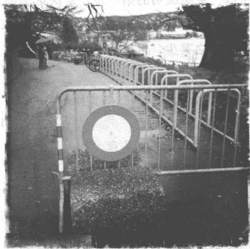
目标明确才能成功

他具备独特的商业眼光，加上他的锐意进取精神，很快就打开了时装业的新天地。他的服装设计大胆突破传统，具有时代感与青春感。他在厚厚的呢料大衣上打上皱褶，用透明面料做胸前打上皱褶的上衣，让新娘穿上超短裙，使模特穿上带网花的长筒袜，甚至设计出“超短型”的大衣与气泡裙。他还