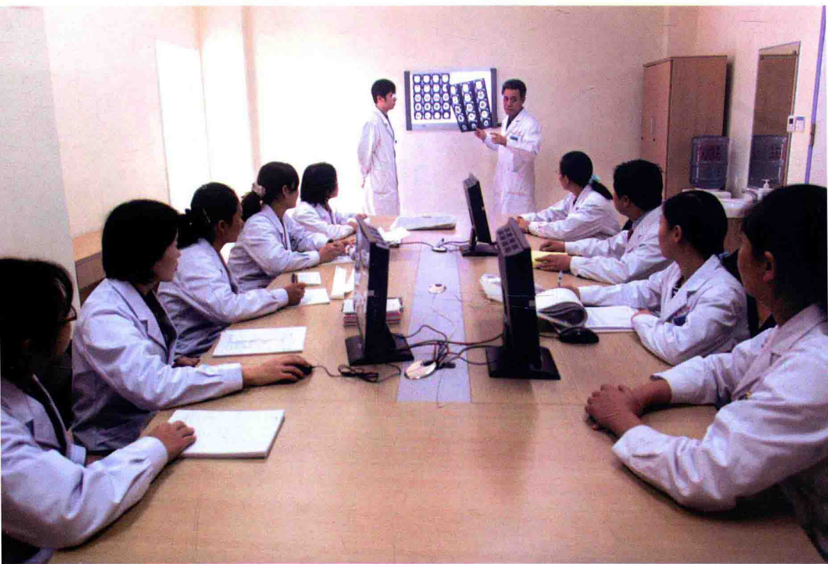
> 科室疑难病例讨论