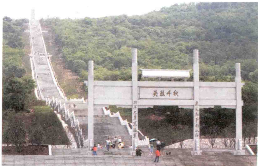
2015年3月竣工的张自忠将军殉国处纪念园全景

张自忠将军是伟大的抗日民族英雄。将军殉国宣城十里长山之后，人们在上世纪先后修建了张上将自忠殉国处纪念碑、同难官兵公墓和张自忠将军纪念馆。多年来，这些纪念设施一直是宣城纪念张自忠将军，缅怀革命先烈，弘扬革命精神，开展传统教育的重要阵地。