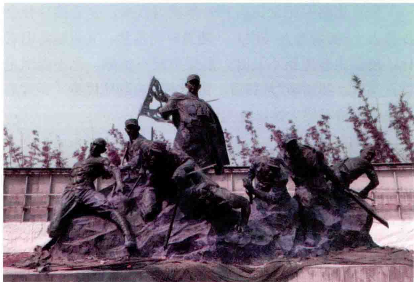
位于同难官兵公墓的群雕

今年6月，市委、市政府对张自忠将军殉国处纪念园进行了二期扩建，按3A级景区标准打造。新建了造型别致、庭院式游客接待中心，沿阶梯而上，用张将军爱民爱国、带兵御敌的35块经典语录组成文化长廊；在同难官兵公墓，新建了与十里长山相对应的大型浮雕，山峦起伏，青松滴翠，张自忠将军纪念碑巍然屹立，将整个纪念园与公墓融为一体；在杏仁山下，用铸铁打造28名栩栩如生的手枪营官兵，仿佛还在山野中搜索前进；在公墓北侧增加了一组大型群雕，生动再现张自忠将军带领将士浴血奋战、前赴后继的壮烈场景。配套建设了四个生态停车场、两个公厕、一个山顶茶室，扩建刷黑了通山公路，使殉国处纪念园功能更加完善，交通更为便利，成为十里长山风光带中的核心景区。