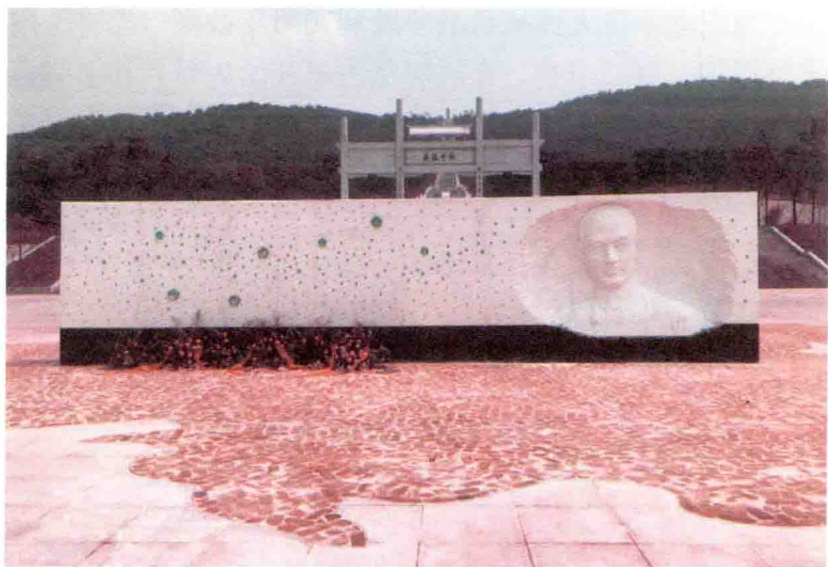
位于纪念园广场的汉白玉张自忠将军雕像

5月的张上将自忠殉国处纪念碑最早由将军部下黄维纲指挥修建。纪念碑位于长山次峰，寓意当时的抗日战争还未彻底胜利；碑高3.3米，寓意三十三集团军；用95块青石板垒砌而成，为59的倒写，寓意五十九军，张自忠将军生前兼任五十九军军长。修碑所用石料从襄阳观音阁采得，用船运至王集码头后，用72辆牛车运到长山。去年兴建纪念园时，在纪念碑后1.2米处新建了佛龕（kan）碑，碑高16米，装饰部分为5米，寓意为张自忠将军殉国日，永远不忘5月16日。三是对同难官兵公墓进行了修葺。该墓始建于1941年春，位于当年南瓜店战役之主要战场——杏仁山东麓，与长山次峰上的殉国处纪念碑遥相对应。主要是对公墓及周边环境进行硬化。一期工程完工后，大大方便了人们开展纪念活动。