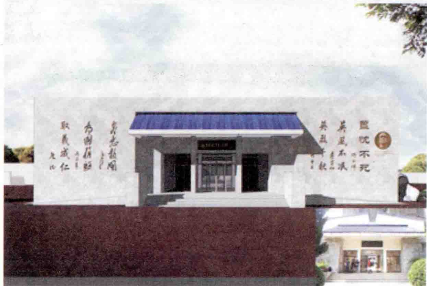
2015年8月将重新修缮的张自忠将军纪念馆效果图

为纪念中国人民抗日战争胜利70周年暨张自忠将军殉国75周年，宜城市委、市政府从去年开始先后启动了张自忠将军殉国处纪念园建设工程和张自忠将军纪念馆修缮工程，以便更好地发挥其纪念、瞻仰和教育功用。