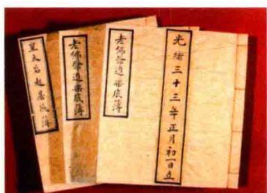
慈禧太后进药底簿