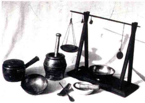
光绪年间太医院药具