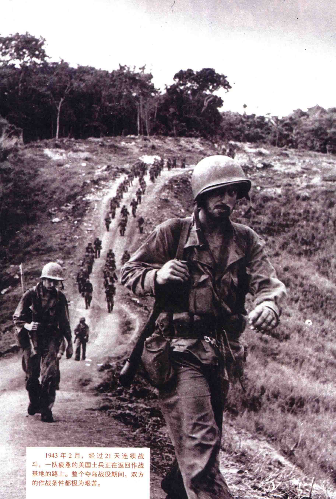
1943年2月，经过21天连续战斗，一队疲惫的美国士兵正在返回作战基地的路上。整个夺岛战役期间，双方的作战条件都极为艰苦。