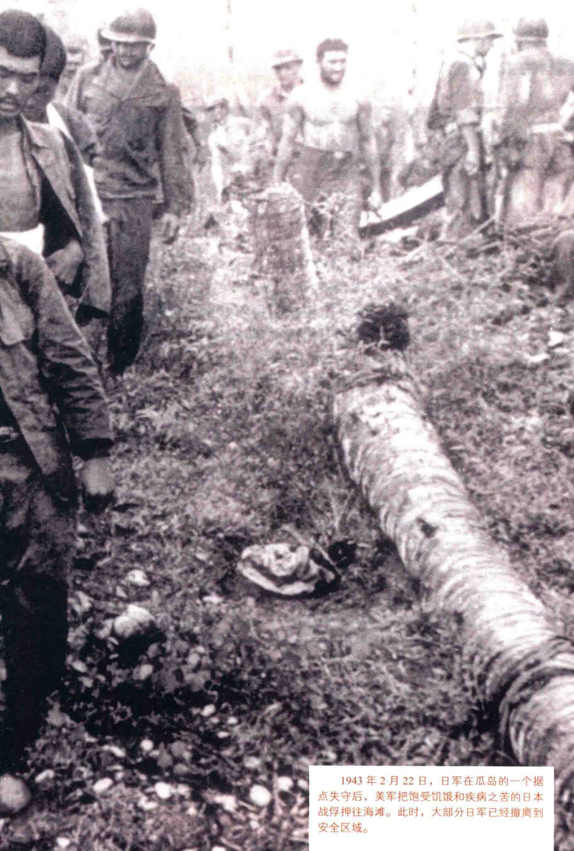
1943年2月22日，日军在瓜岛的一个据点失守后，美军把饱受饥饿和疾病之苦的日本战俘押往海滩。此时，大部分日军已经撤离到安全区域。