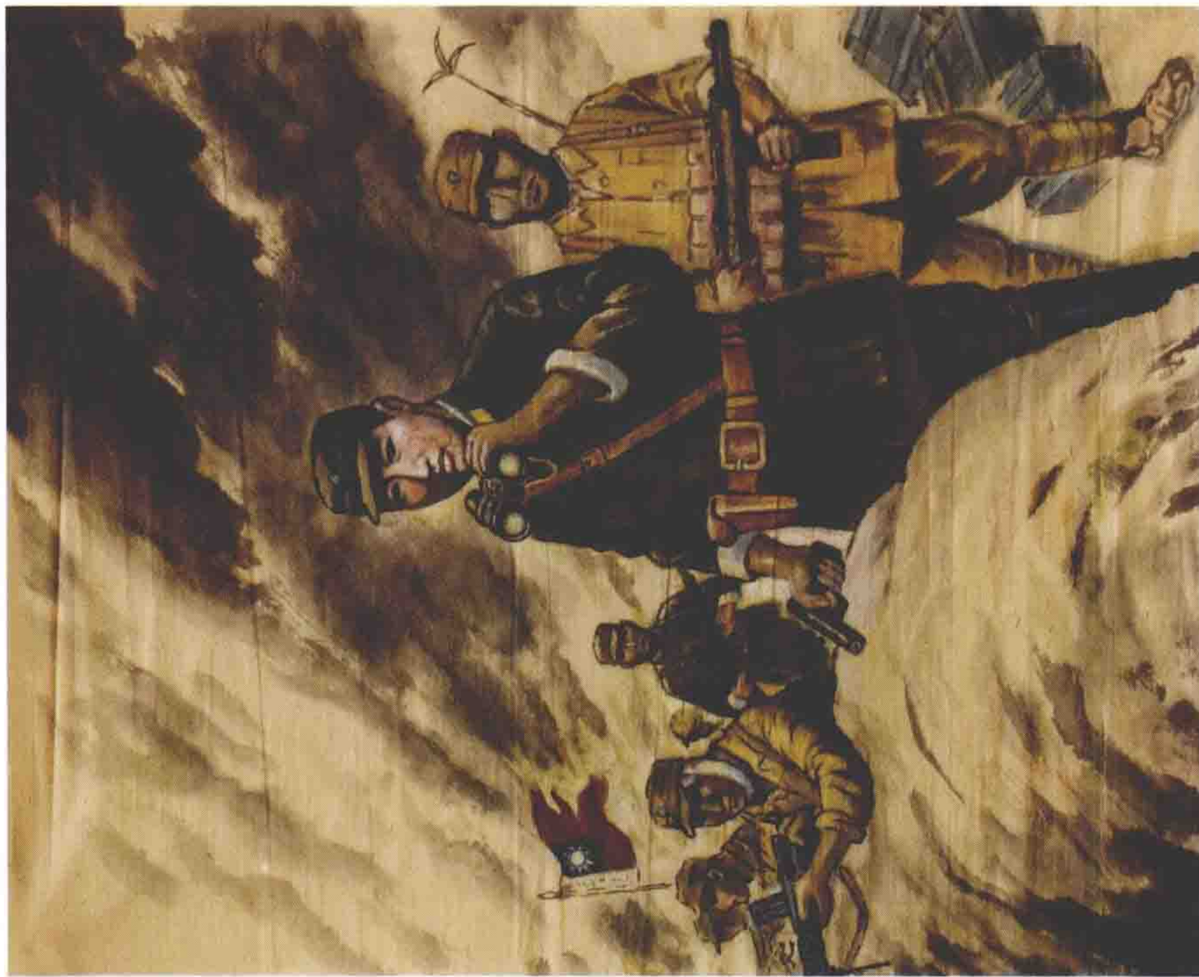
方先觉在前线指挥战斗（国画） 刘学德画