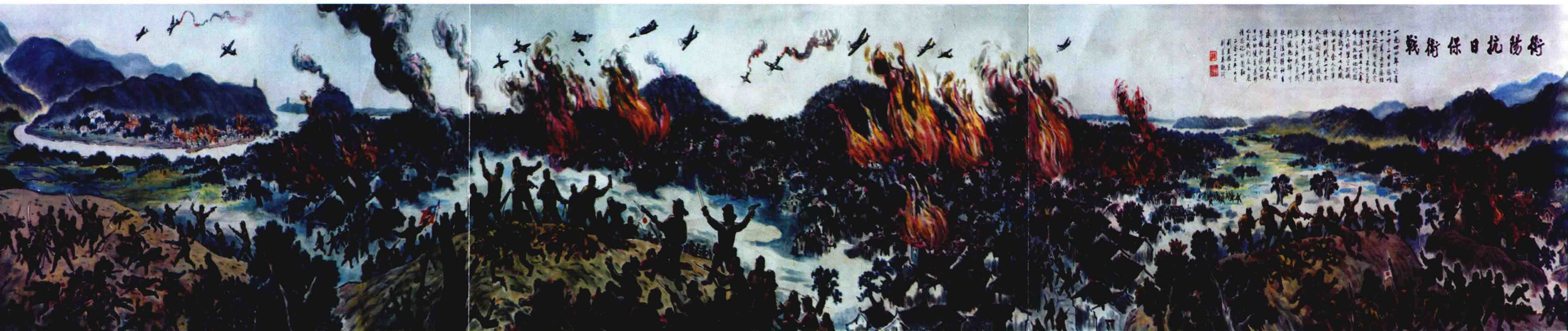
衡阳保卫战（国画） 二米长卷 刘学德画