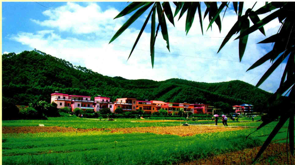
丽堂村及其无公害蔬菜基地

从杨梅观音禅寺出来，车子往杨梅方向走，绕过杨梅市场走杨宅线，行车 22 分钟，呈现在眼前的景点就是丽堂农业观光基地。这个基地位于杨和镇丽堂新村，那里种植了 300 多亩各种蔬菜，举目四望，这个基地周围厚厚的竹木林带包围，阻隔了外面的灰尘废气，成为远近闻名的“无公害蔬菜”基地，这里，周围 20 平方公里范围无工业污染，村民常年使用山泉水以自动化洒水系统灌溉菜地，所有蔬菜均全施用农家肥，采用灭蛾灯防虫，没有使用化肥农药，保证了所有丽堂蔬菜出品的“安全、无污