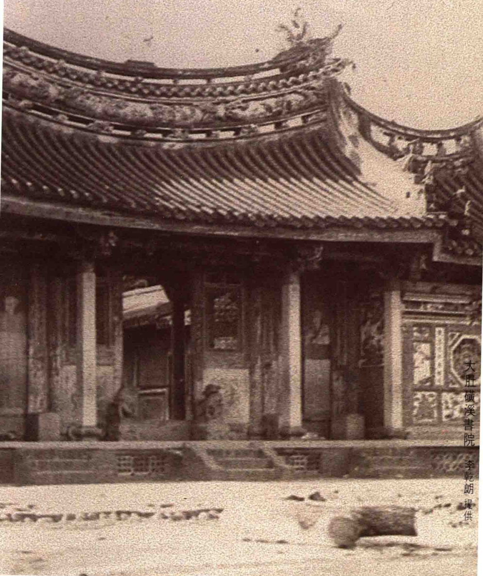
大肚壩溪書院