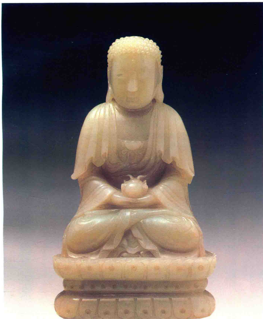
清代白玉雕佛像 估价:600000—630000 元