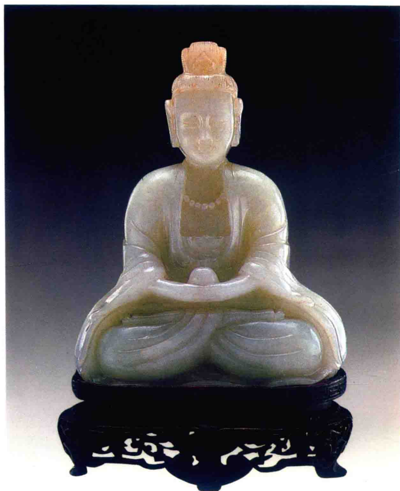
明代白玉像 高 18cm 估价:400000—450000 元