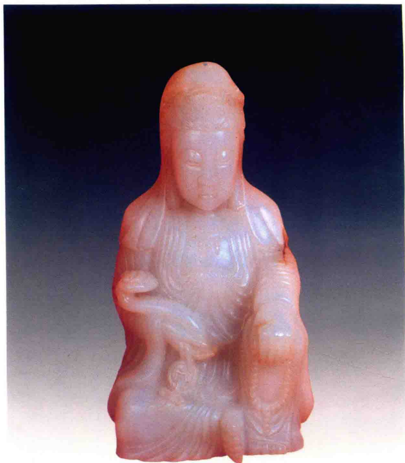
明代白玉像 高 23cm 宽 11.5cm 估价:400000—450000 元