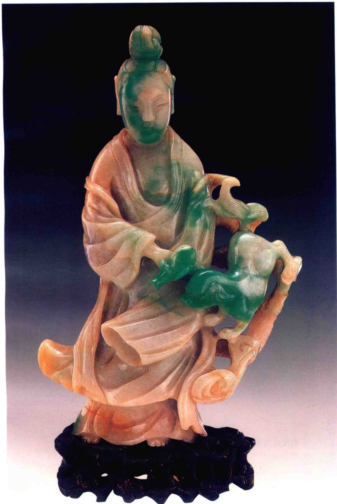
清代翠玉菩萨像 高19cm 估价:600000—630000元