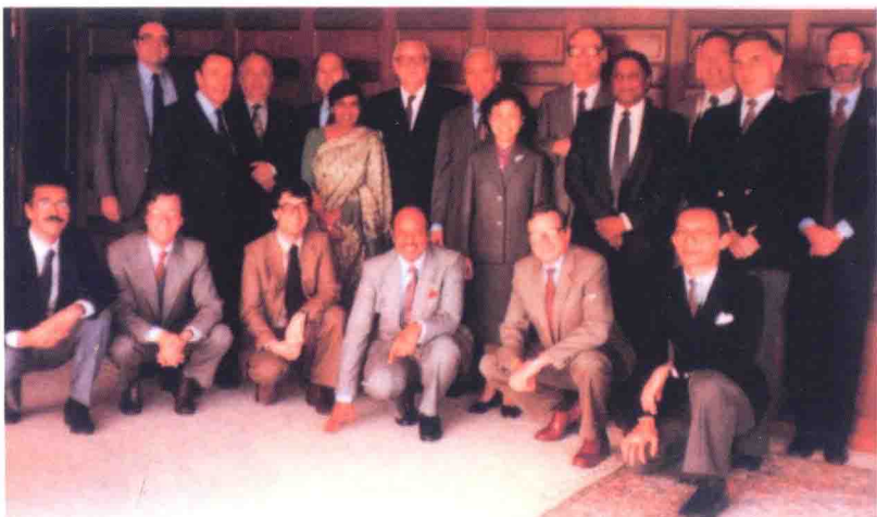
中国加入《巴黎公约》工作组照片

中国常驻联合国日内瓦代表团代表李鹿野大使向世界知识产权组织总干事阿帕德·鲍格胥递交中国加入《保护工业产权巴黎公约》(1967年斯德哥尔摩文本)加入书。自1985年3月19日起,中国正式成为《巴黎公约》成员,开始承担起保护原产地名称(地理标志)的义务。