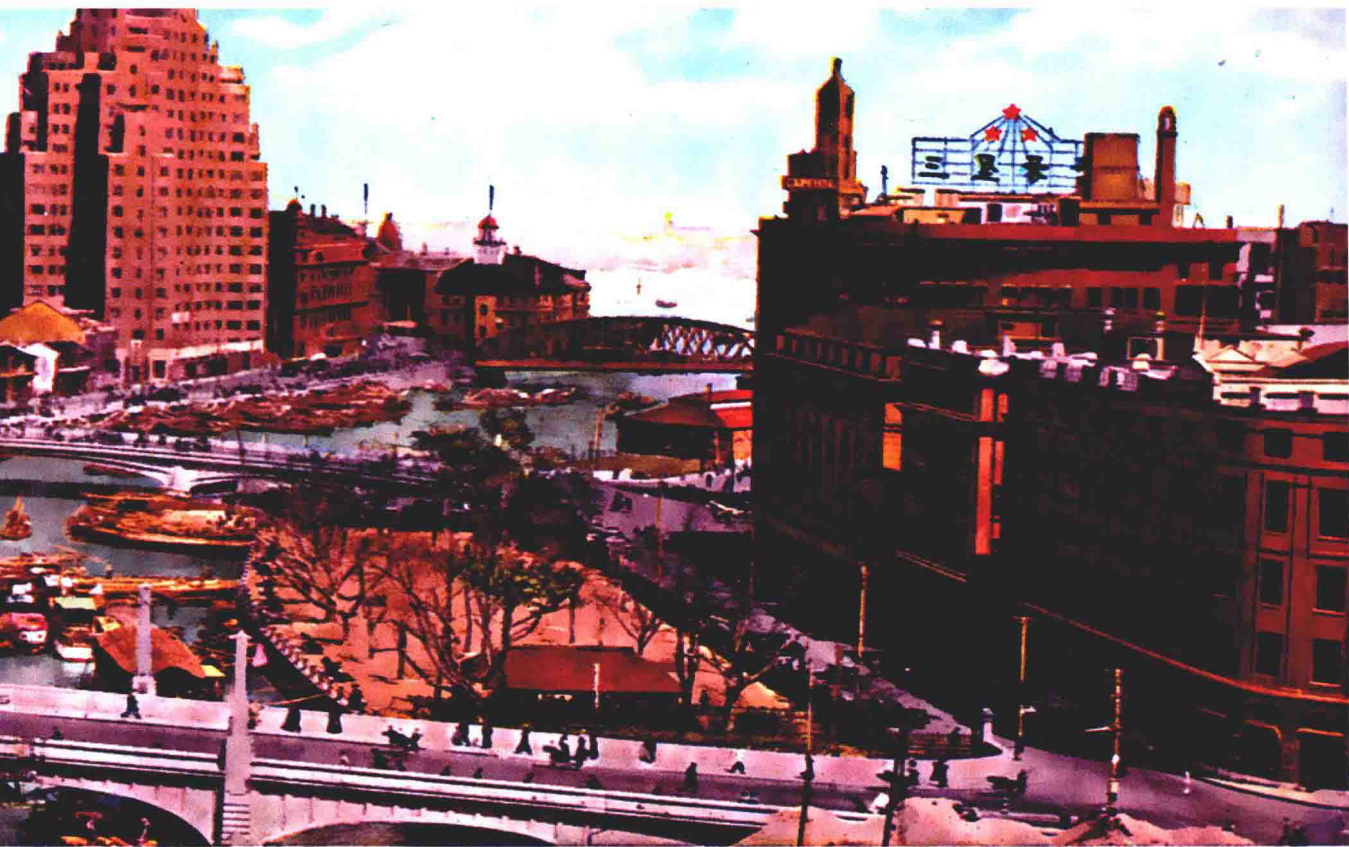
望遠ノ「グンデルピ・イエウドーロブ」