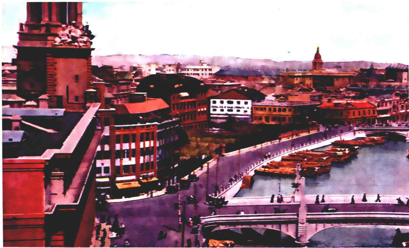
FAR SIGHT OF THE BROADWAY BUILDING, SHANGHAI.