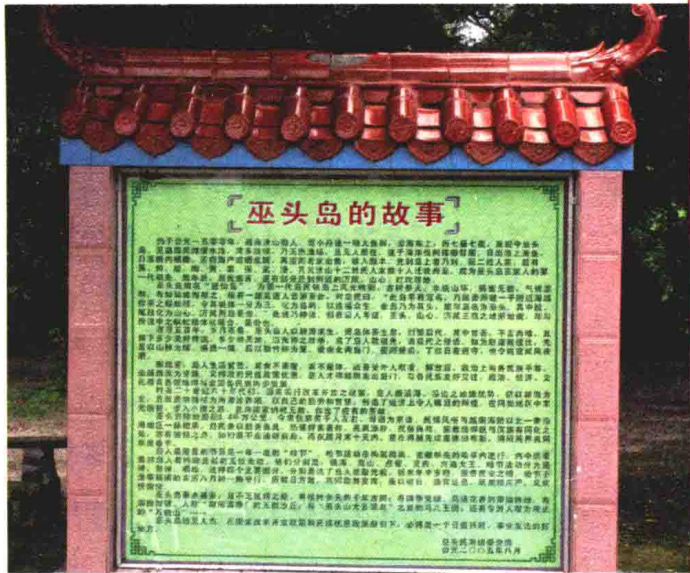
▲ 关于巫头岛来历的故事/黄安辉 摄/2007年

海洋渔业民族虽然不像游牧民族那样，具有很强的流动性，但比起重视安土重迁的农耕民族来，它的流动性还是相对要强一些。由于渔业资源的暂时性短缺，需要寻找新的空间来维持生活，或者是受天气等客观因素的影响，渔民们可能会从原来的居住地逐渐迁移到另外一个地方，这是很正常的现象，闽、粤沿海渔民向菲律宾等地移民就是明显的例证。