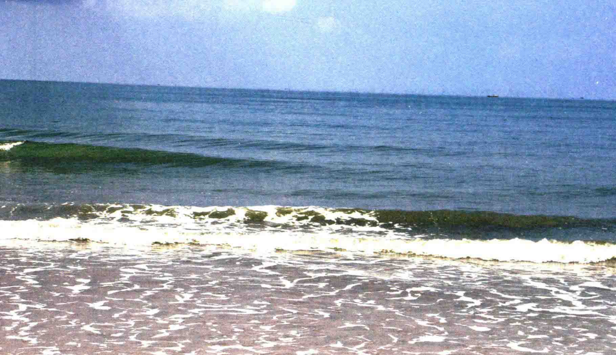
▲ 浩瀚的大海是京族人民重要的生活来源/2007年