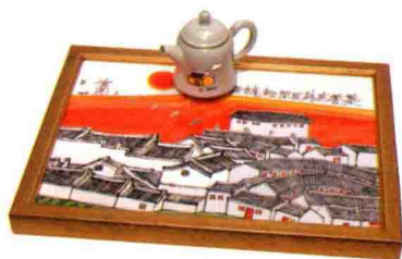
吳德亮作品／蔡長宏銅補