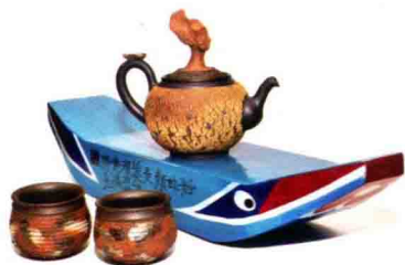
游正民茶器／吳德亮茶船