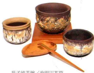
吳孟純茶碗／翁明川茶荷