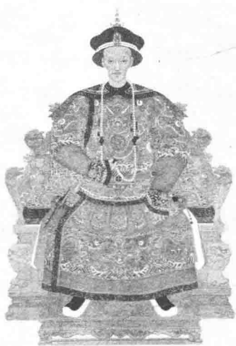
清宣宗·道光皇帝，颇想重振大清雄风

史籍记载：嘉庆、道光年间，朝风日坏。当时财政开支有一个重要项目，即治河。但每年治河之费，真正用于工程的不到十分之一，其余皆被挥霍。官吏饮食衣服，车马玩好，无不斗奇逞巧。一次宴请常常三昼夜而不能毕。