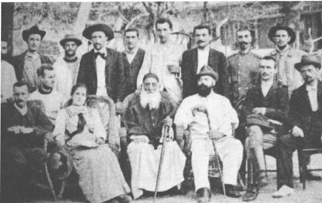
火烧圆明园帝国主义掠夺者合照