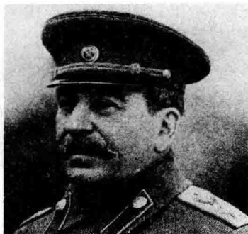
斯大林 | Joseph Stalin

斯大林格勒是德国法西斯军队覆灭的起点。大家知道，德军在斯大林格勒大激战以后，已经不能恢复自己的元气了。