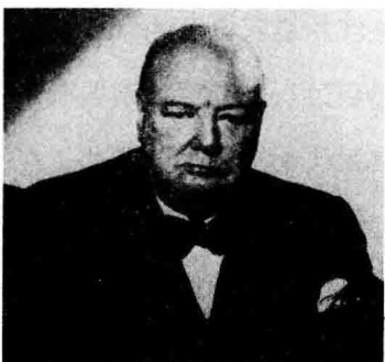
丘吉尔 | Winston Churchill

我谨以美利坚合众国人民的名义向斯大林格勒发去此信，以表达我们对英勇的保卫者的敬意。他们所表现的坚毅勇敢和自我牺牲精神将永远鼓舞一切自由的人们。他们的光辉的胜利成为同盟国反侵略战争的转折点。