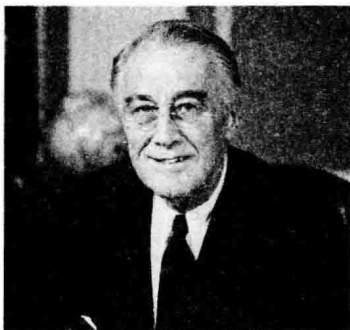
罗斯福 | Franklin Roosevelt

斯大林格勒是德国法西斯军队覆灭的起点。大家知道，德军在斯大林格勒大激战以后，已经不能恢复自己的元气了。