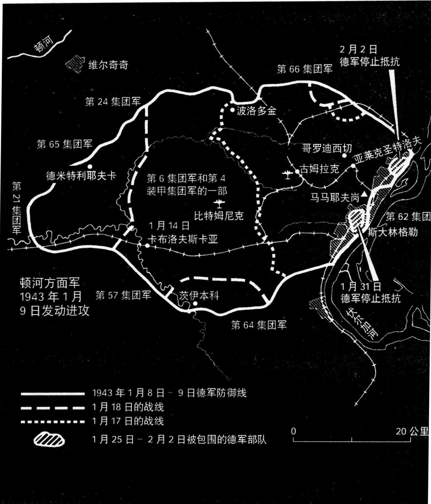
右图：1943年1月~2月，斯大林格勒战役中展开战略反攻的苏军与被围的德军双方态势图。