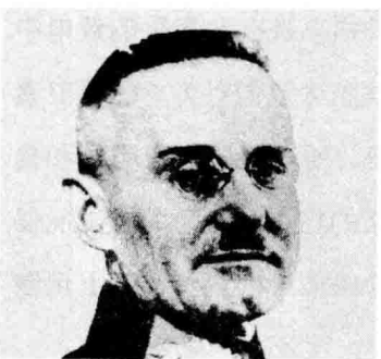
哈尔德 | Franz Halder