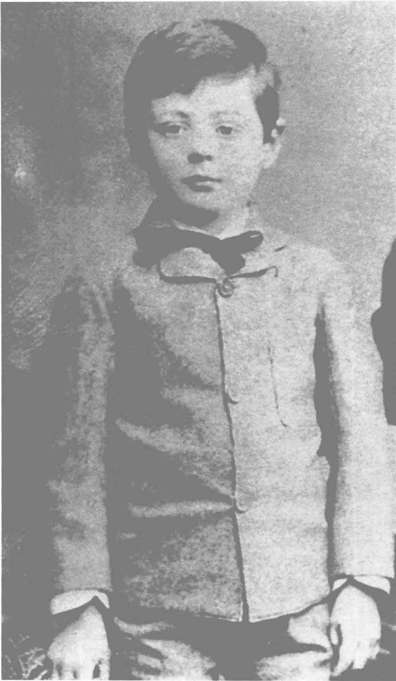
◎丘吉尔五岁时在都柏林的照片。