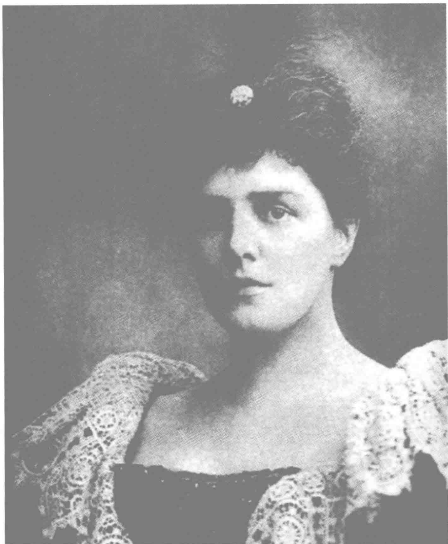
◎丘吉爾的母親倫道夫·丘吉爾夫人。娘家的名字是詹妮·杰羅姆，她是美國百萬富翁倫納德·杰羅姆的第二個女兒。1873年夏天，詹妮·杰羅姆在英國的考斯特城遊覽時，遇見了倫道夫·丘吉爾。倫道夫·丘吉爾對她一見傾心，幾個月後他們便結為伉儷。