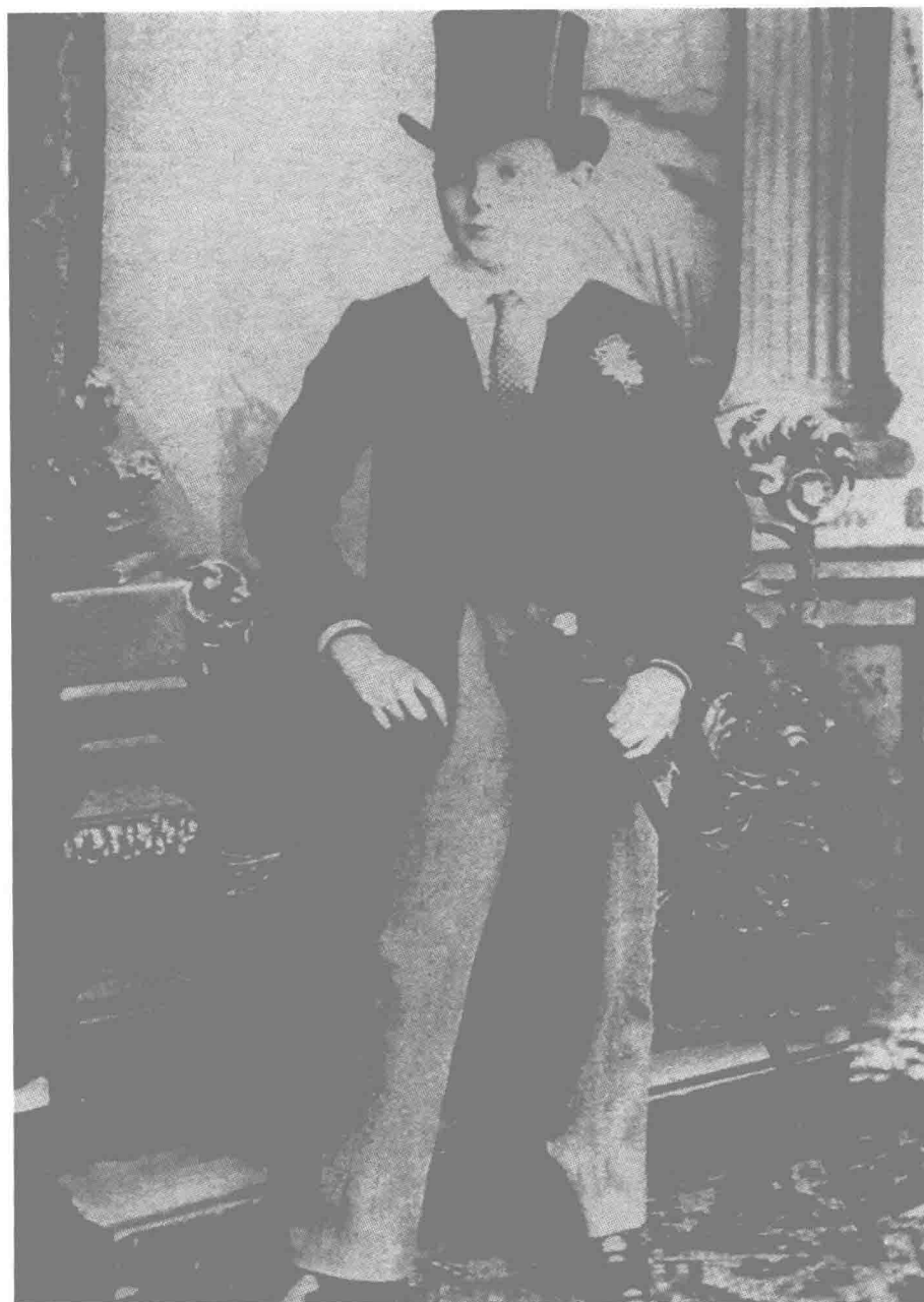
◎学童时代的丘吉尔，1889年。