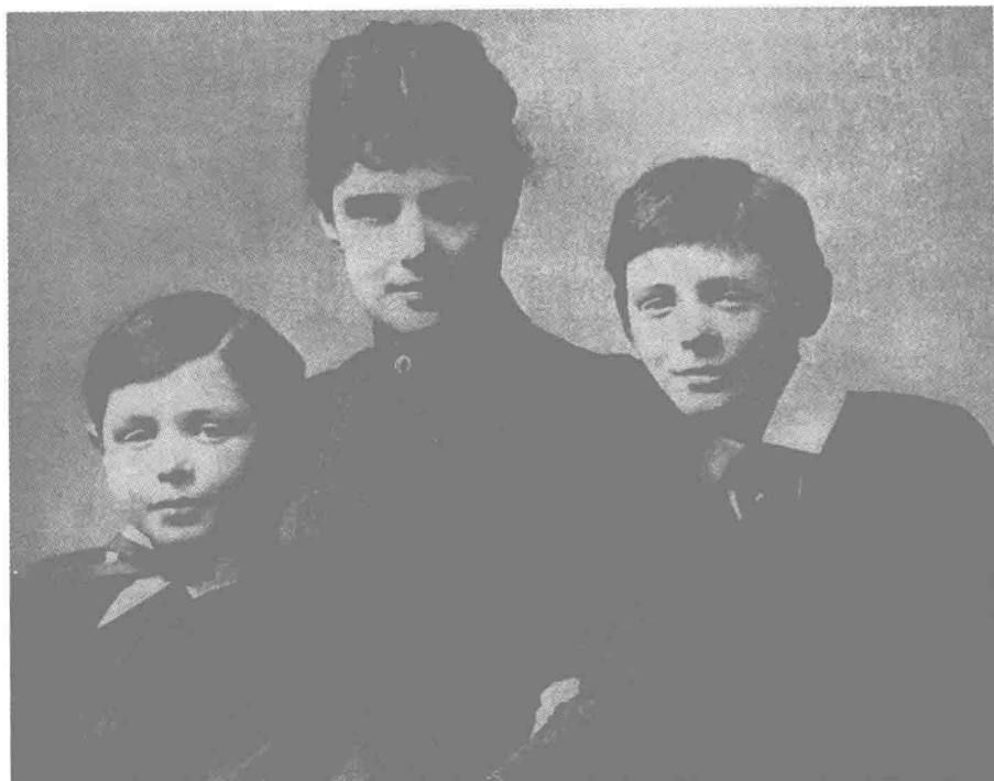
◎ 1889年，伦道夫·丘吉尔夫人和她的两个儿子：杰克和温斯顿。