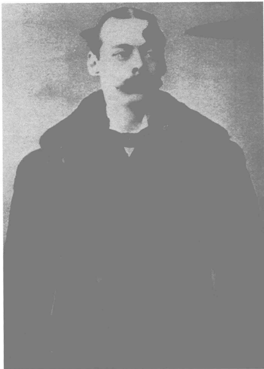
◎丘吉尔的父亲伦道夫·丘吉尔，出身于英国贵族马尔巴罗家族，这一家族按爵位次序列英国二十个公爵家族的第十位。1884年，伦道夫·丘吉尔出任财政大臣和下院领袖，很多人认为他将成为保守党首相。