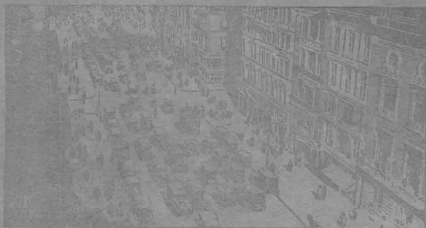
此車之駕駛極其容易而耐用因輛九十車汽有中約羅