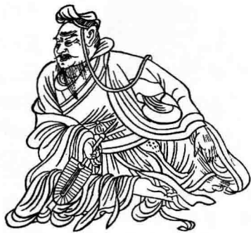
1. 中国化的维摩诘智辩过人(敦煌莫高窟第103窟 盛唐)[采自《敦煌莫高窟艺术》]

在唐代,据传曾经出现过一种专门食人指甲的怪鸟,也是指甲巫术派生出来的故事。唐人刘恂撰《岭表录异》云:“鸺鹠,即鸺也。为鬪由,可以聚诸鸟。鸺鹠昼日目无所见,夜则飞噉蚊虻。鸺鹠乃鬼车之属也。皆夜飞昼藏,或好食人爪甲,则知吉凶。凶者辄鸣于屋上,其将有咎耳。故人除指甲,埋之户内,盖忌此也。亦名‘夜行游女’。与婴儿作祟,故婴孩之衣不可置星露下,畏其祟耳。又名‘鬼车’,春夏之间,稍遇阴晦则飞鸣而过,岭外犹多,爱入人家,烁人魂气。或云九首,曾为犬啗其一,常滴血。血滴之家则有凶咎。《荆楚岁时记》云闻之当唤犬耳。又曰鸺,大如鸠,恶声,飞入人家不祥。其肉美,堪为炙,故《庄子》云见弹思鸺炙。又云:古人重鸺炙尚肥美也。《说文》梟,不孝鸟,食母而后能飞。《汉书》曰,五月五日作梟羹以赐百官,以其恶鸟故以五日食之。古者重鸺炙及梟羹,盖欲灭其族类也。” ② 鸺鹠曰梟,梟食其母留恶名,故做梟羹。