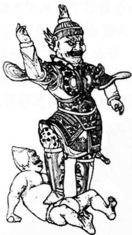
2. 木彩唐人绘天王俑(新疆吐鲁番阿斯塔那唐墓出土)〔采自《中国古俑白描》〕

在古代，运用交感巫术的原理用指甲烧灰来治病：（一）妻子妊娠尿血，必得用丈夫的指甲来治病。明李时珍撰《本草纲目》人部第五十二卷“爪甲”云：“妊娠尿血。取夫爪甲烧灰，酒服。” ② （二）儿子腹胀，必得用自己父母指甲来治病。《本草纲目》卷五二《人部》云：“小儿腹胀。父母指爪甲烧灰，傅上饮之。（《千金方》）” ③ 唐孙思邈撰《千金要方》，简称《千金方》，故李时珍所据是唐代的医书。（三）男得病，必得女子指甲来治其病，反之，女得病，必得男子指甲来治其病。《本草纲目》云：“阴阳易病。用手足爪甲二十片，中衣裆一片，烧灰，分三服，温酒下。男用女，女用男。” ④ （四）孩子胞衣不下，必得用母亲本人的指甲来治病。《本草纲目》又云：“胞衣不下。取本妇手足爪甲，烧灰酒服。即令有力妇人抱起，将竹筒子胸前赶下。” ⑤