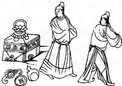
3. 路不拾遗图(敦煌榆林窟第25窟(中唐)欧阳琳绘)[采自《敦煌学大辞典》]

庚申日既然是三尸虫告状之日，对道士而言，最好的办法是这天呆在家里，什么地方也别去，这就叫宜守庚申也。按《酉阳杂俎》的说法叫“守庚申”。前集卷二《玉格》云：“七守庚申三尸灭，三守庚申三尸伏。” ⑤ 这便是道家的修养之术，即于庚申之日，通过斋戒静坐不眠排除杂念，安定魂魄，并服用一些药物，实际是营养品：枸杞子、枣子、桃根桃叶茶、淳大醋等，加上叩齿、向东静坐运气、参拜运动等等，来预防克服三尸之灾，谓之“守庚申”。《真诰》卷一〇云：“凡甲寅庚申之日，是尸鬼竞乱，精神躁秽之日也。不可与夫妻同席及言语面会，当清斋不寐，警备其日，遣诸过咽液七过，此名为帝君，炼形拘魂制魄之道。使人