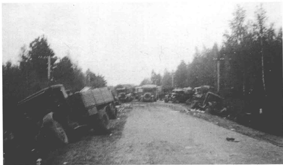
被击毁的苏联卡车堆满了德军前进的公路两侧。