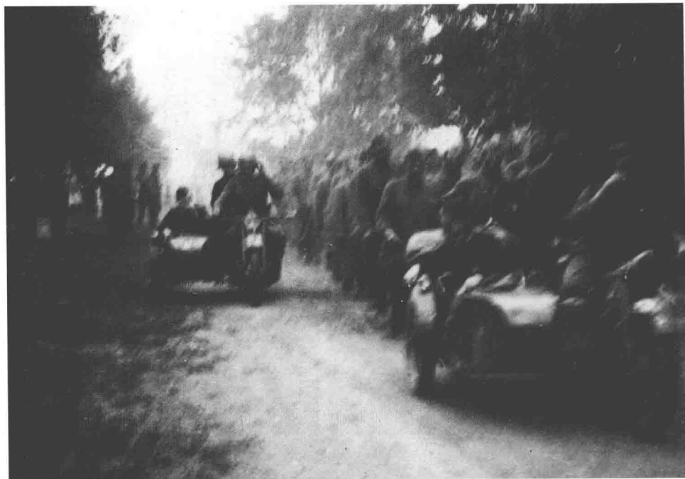
一长列战俘由第3侦察营的摩托步兵押送前往战俘营。这种场景在东线的第一个夏天很常见。