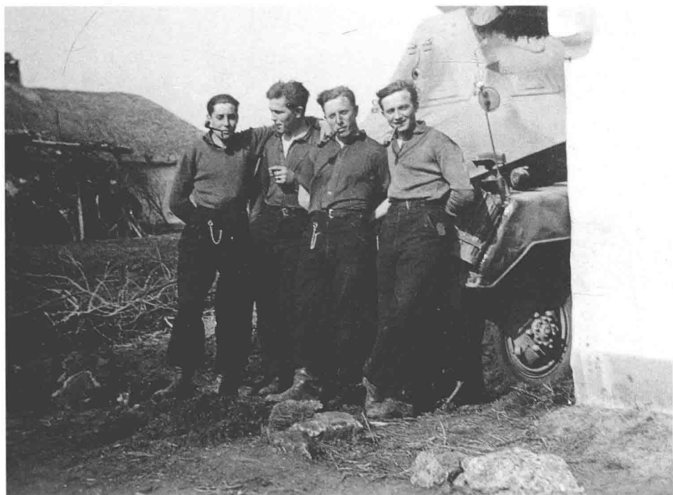
这群“d.Kfz.263”（无线电型）（8轮）装甲车乘员在车前抽烟放松。