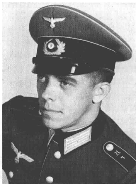
这位侦察兵来自第4装甲师第7侦察营（如果是玫粉兵种色）或者第2轻装师的第7侦察团（如果是金黄兵种色）。肩章上的A/7很可能是他在摄影棚让摄影师帮忙加上去的，因为字体的大小和他穿着的礼服比起来很不协调。