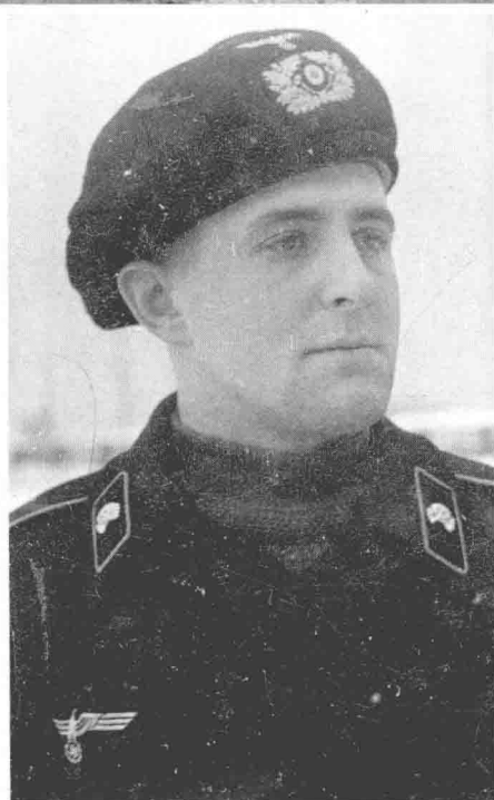
这位侦察兵穿着一件流行的圆领毛衣，可以帮助他在没有加热器并且是开放式的装甲车里抵抗寒冷。