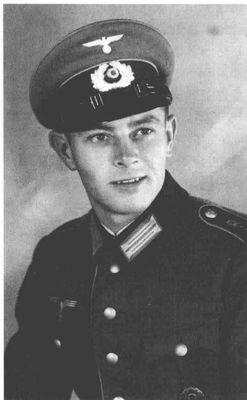
这位来自第1装甲师第1摩托步兵营的步兵穿着礼服（Geschmuckte Feldbluse），肩章上绣着K/1的字样。

据了解这种帽徽只有装甲教导师下辖的装甲侦察教导营所使用过。而且留下的照片里也只有一个人佩戴，所以也可能只是他个人的创意。