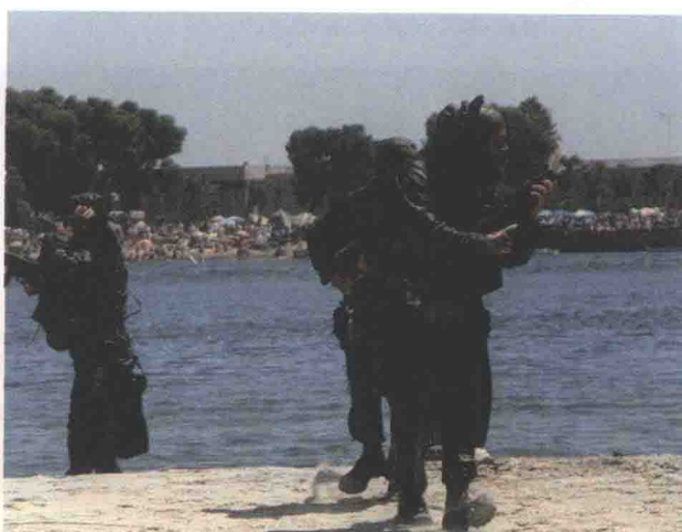
▲ 海豹队员演示如何进行海滩巡逻。