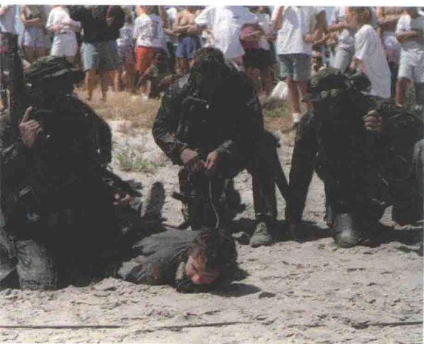
▲ 海豹队员演示如何擒获、捆绑犯人。