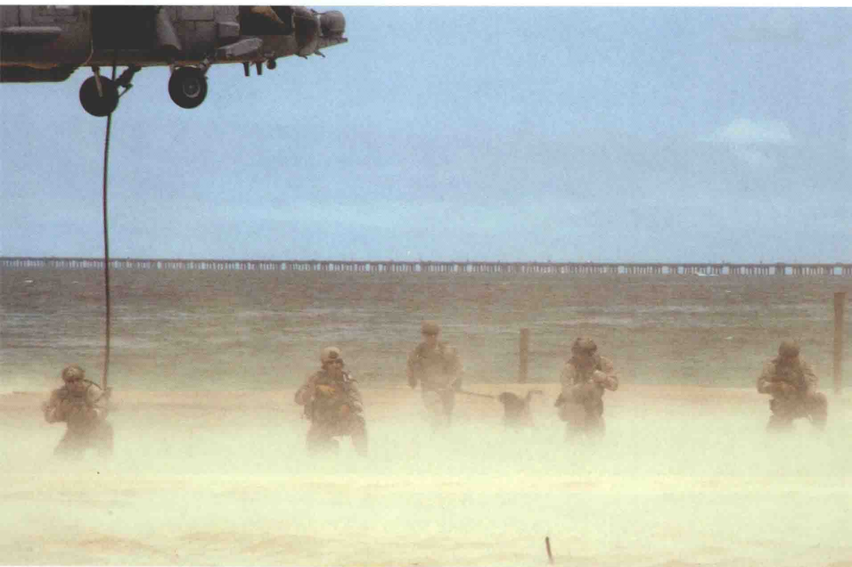
▲ 在弗吉尼亚州小克里克进行的第41届水下爆破队/海豹东海岸重聚活动的的能力展示中，海豹队员从直升机上迅速绳降滑下。