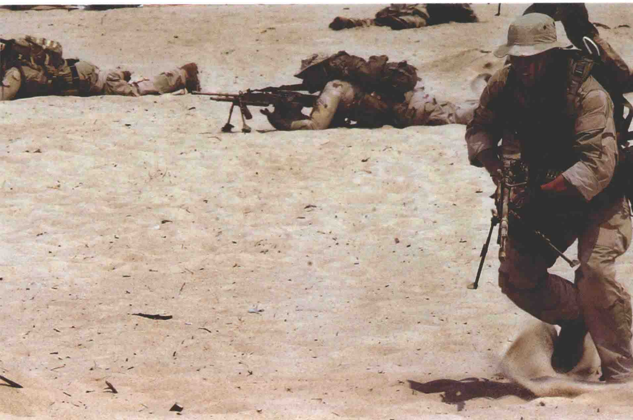
▲ 海豹们演示如何夺占海滩。注意他们的战术配合，在部分人员移动时，其他人则负责提供火力支援，这是在海豹战术训练中反复练习的科目。