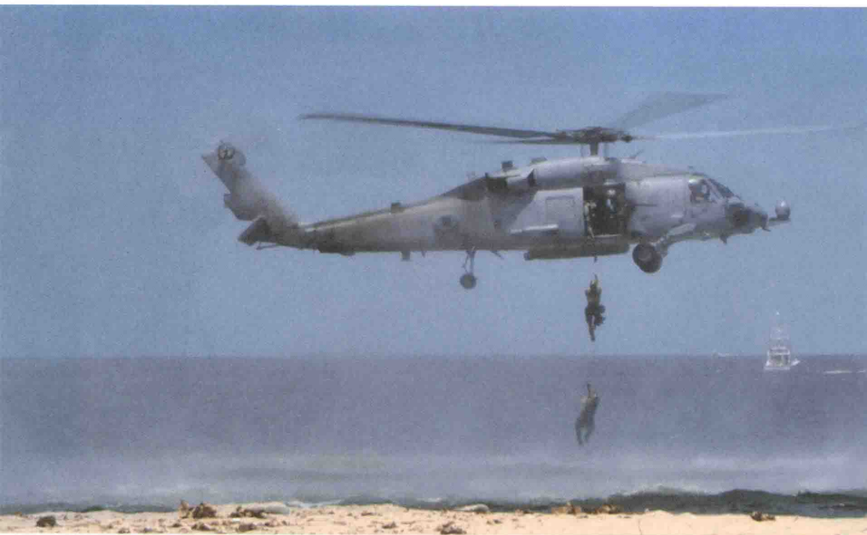
▲ 2011年7月16日，弗吉尼亚州弗吉尼亚比奇，在第42届水下爆破队/海豹东海岸重聚活动的的能力展示中，两名海豹队员正通过软梯爬上一架SH-60“海鹰”直升机。