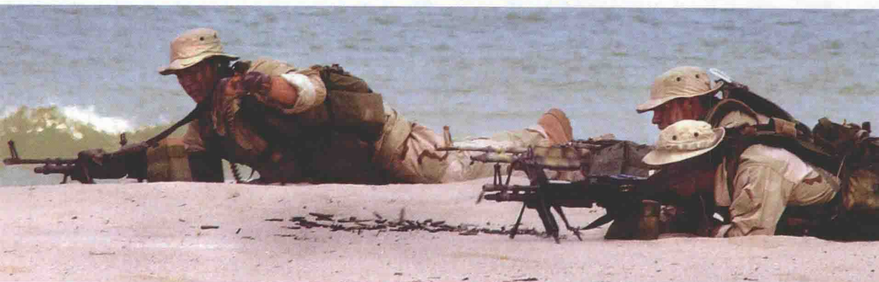
▲ 海豹小组在登陆后占据沙滩。他们使用 M60 型通用机枪进行火力支援。相对于规模较小的海豹班而言，M60 机枪可以提供充足的火力。