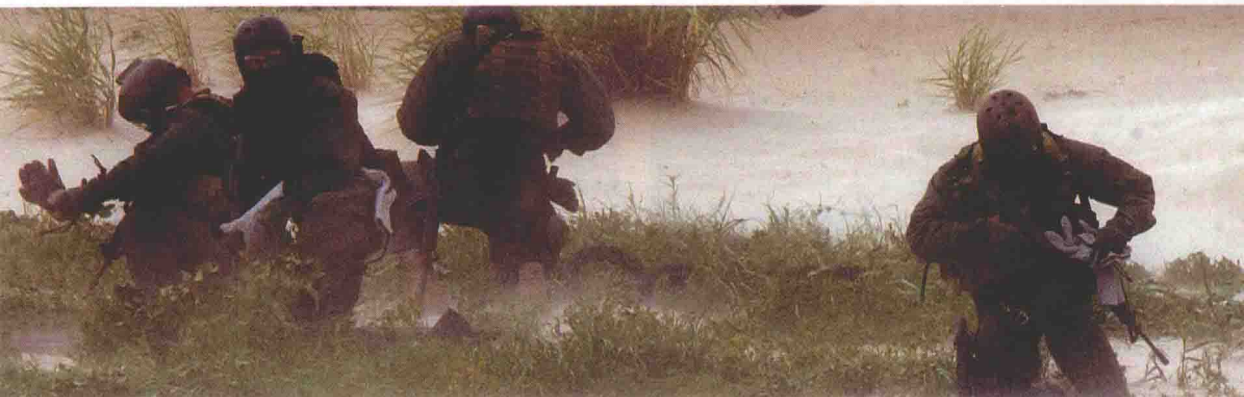
▲ 海豹小组在进行战术演练。