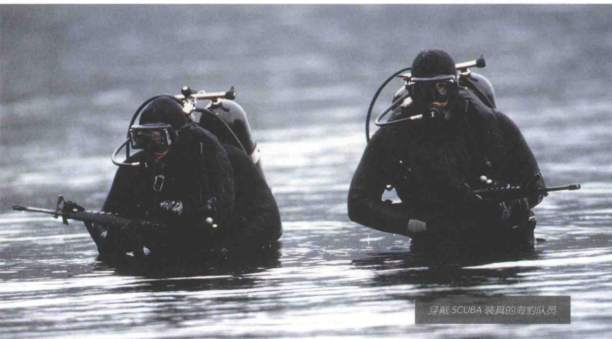
穿戴 SCUBA 装具的海豹队员