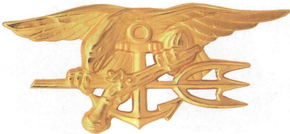
▲ 美国海军特种作战“三叉戟”徽章（海豹标识）

海豹标识，又名海豹“三叉戟”徽章，是美国海军海豹突击队成员的专属标识，也是海豹队员可以获取的超过20种军事标识中最重要的军事标识，海豹队员亲切地称之为“Budweiser”。Budweiser是一个自创词，其字面意思是“通过BUD/S训练者”。海豹徽章是美国海军中最受推崇的军事标识之一，击毙本·拉登的“海神之矛”行动的名称即来自海豹徽章中三叉戟图案的启发。