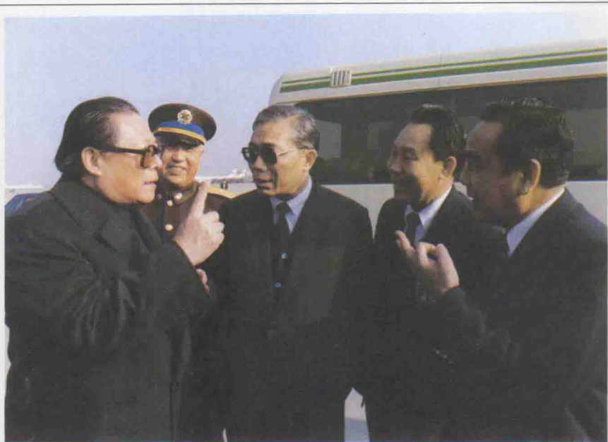
1989年11月26日，江泽民总书记亲临上海虹桥国际机场，听取民航局局长胡逸洲（左三）、民航华东管理局局长高世昌（左四）、中国东方航空公司总经理袁桃园（右一）的工作汇报