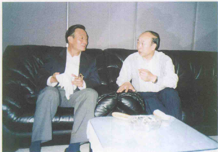
1997年10月4日，中共中央政治局委员、国务院副总理吴邦国在上海亲切接见东航党委书记富允弼