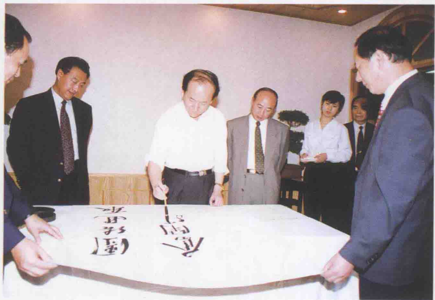
1997年10月15日，民航总局局长陈光毅为东航题词：“团结 进取 奋斗 腾飞”