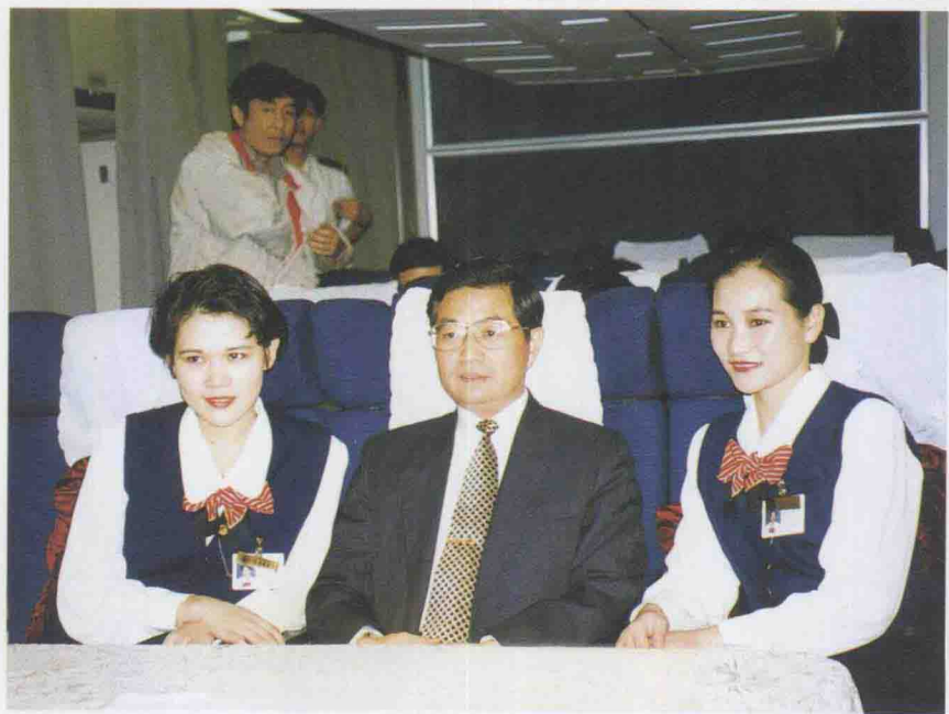
1995年11月9日，中共中央政治局常委 胡锦涛在东航专机上与乘务员合影