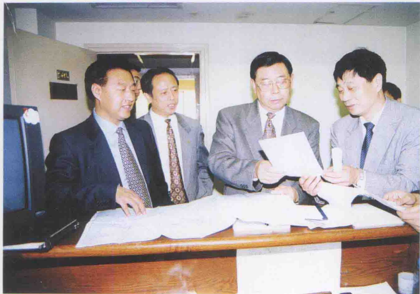
1998年10月31日，民航总局局长刘剑锋（右二）在东航视察工作