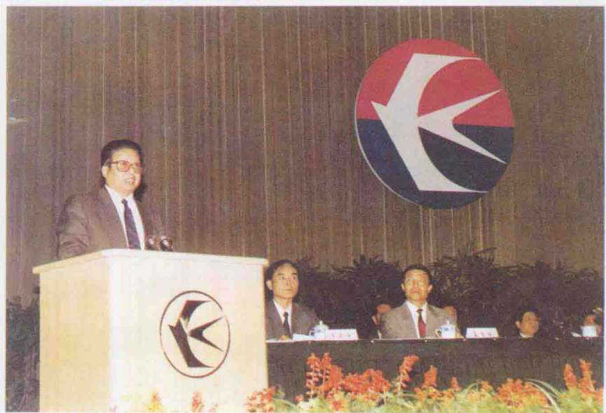
1993年10月6日，民航总局局长蒋祝平 在中国东方航空集团成立大会上致词