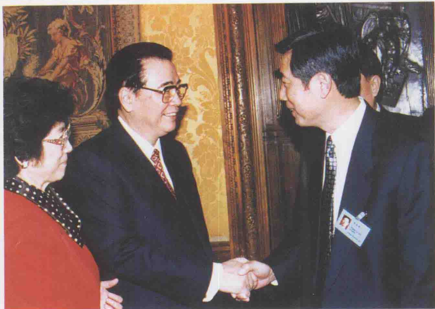
1996年4月13日，李鹏总理亲切接见东 航总经理王立安