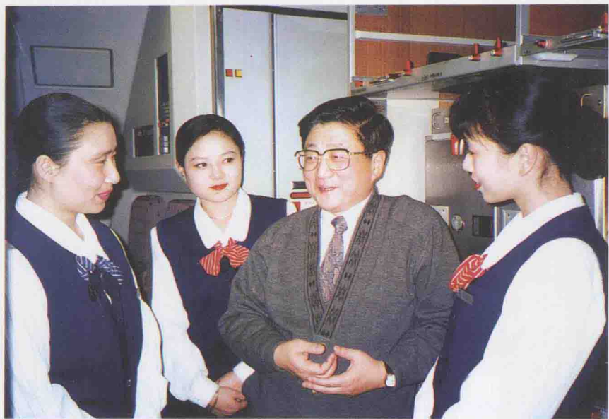
1997年4月29日,中共中央政治局委员、 上海市委书记黄菊与东航乘务员亲切交谈