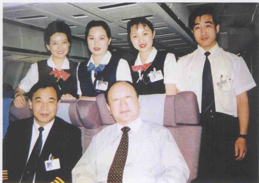
1997年12月17日，上海市市长徐匡迪 在东航班机上与机组人员合影