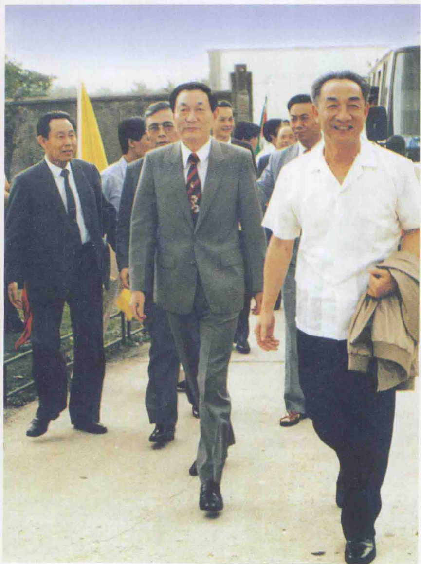
1988年6月25日，国务委员邹家华、上海市市长朱镕基参加民航华东管理局、中国东方航空公司、虹桥国际机场成立大会