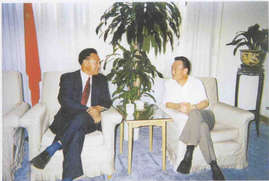
1997年9月8日，中共中央政治局委员、国务院副总理吴邦国在北京亲切接见东航总裁李仲明