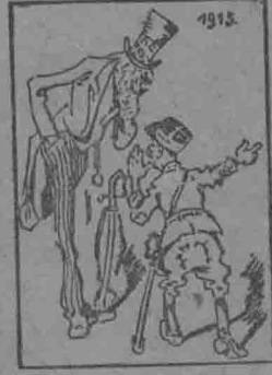
法：德國帶着許多武器，可怕得很！

的推測，繼起組織的，或者將以社會黨為中心，聯合中央黨民主黨等而組織混合內閣，亦未可知。德國無論什麼舉動，終是與賠償問題有關係的。況這次選舉正在專家委員會擬具報告，賠償問題漸有解決傾向的時候，德國的新國會能否接受，實是目前最重大的問題。照各黨的主張看來，除右翼的各政黨外，其餘各黨大都是主張接受的。所以專家計劃似乎定可為新國會所