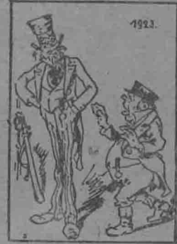
英：法國全副武裝起來了，這都是從德國奪來的。擬具報告，賠償問題漸有解決傾向的時候，德國的新國會能否接受，實是目前最重大的問題。照各黨的主張看來，除右翼的各政黨外，其餘各黨大都是主張接受的。所以專家計劃似乎定可為新國會所