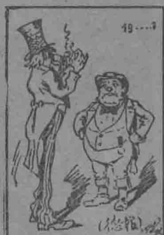
美：唉，這是怎樣一回事？叫我左右為難！