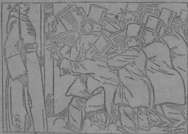
對俄之承認，忙於架築統及不待