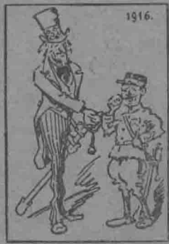
美：我幫助你！全世界也定能助你的！打倒他的！