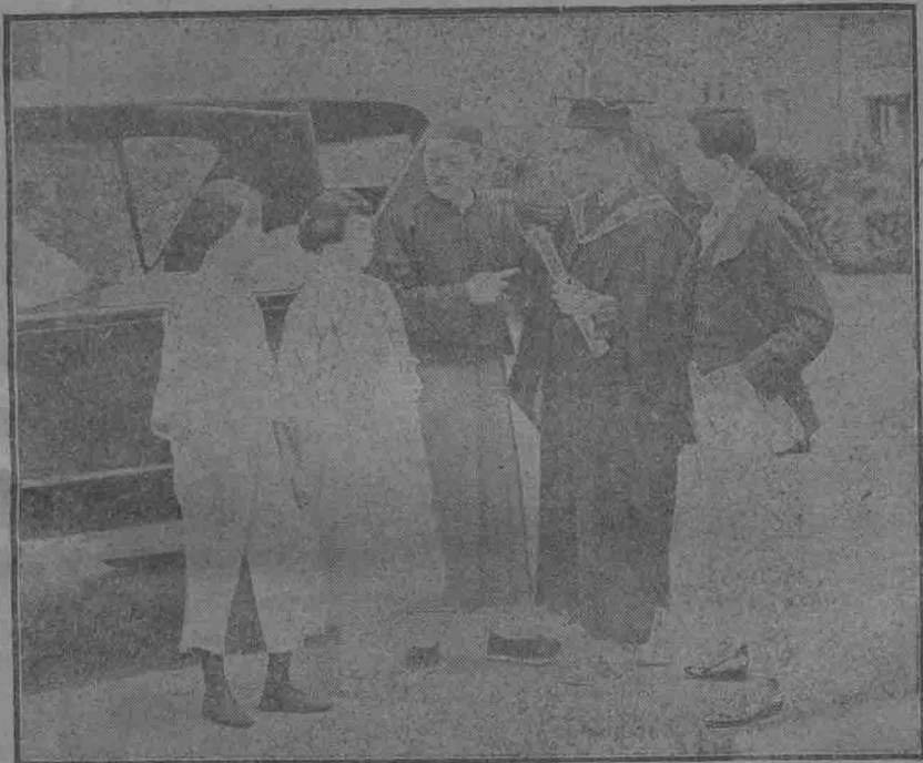
(中校於晤歡獨公交其仙亞妻其與後業學和元鄭)