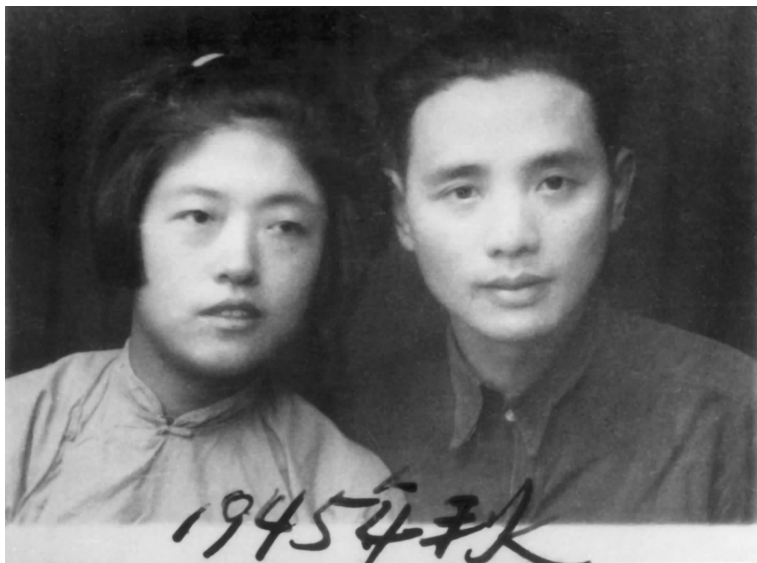
我们婚后的第一次合影(1945年在苏北兴化)

组织部写报告要求结婚,并选定1945年3月18日巴黎公社纪念日为婚期,地点在宝应县境内油坊头驻地。没有任何婚礼仪式,就在老百姓家里,把两个背包合在一起成了家。