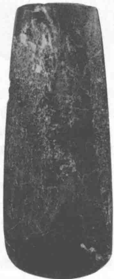
积石山县关家川乡何家槽出土的新石器时代石斧（积石山县博物馆藏）

甘肃大地湾文化的彩陶是中国彩陶的起源，而仰韶文化晚期的马家窑类型的彩陶最负盛名。无论在数量上，还是在文化品位上，马家窑类型的彩陶在整个新石器时代都是空前绝后的，在技术和艺术上登上了一个高峰，代表了中国彩陶艺术的最高成就。1954年，中国历史博物馆（今国家博物馆）内展出了一件马家窑类型彩陶瓮，这件文物一经亮相，便以其