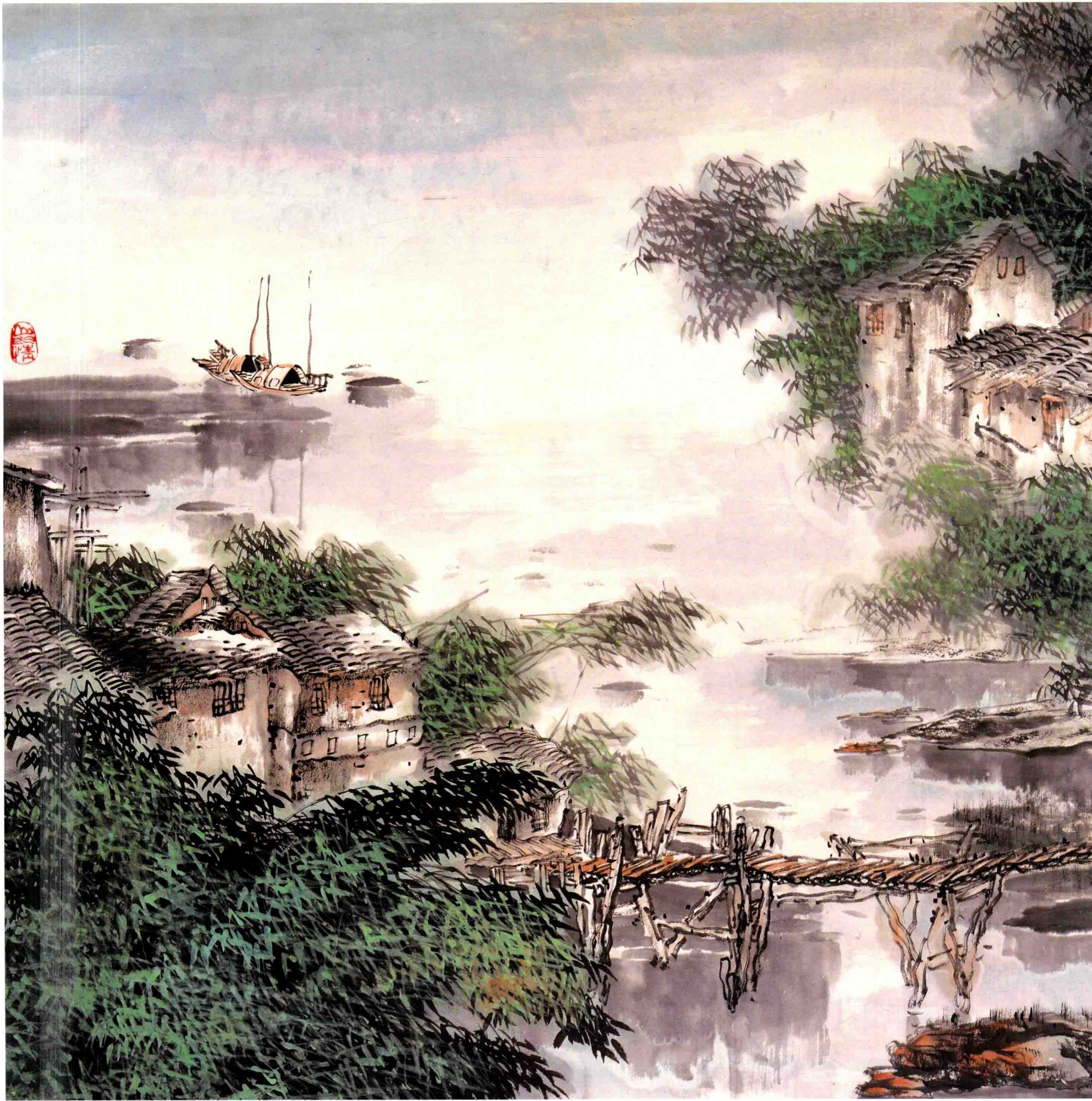
湘西春雨染翠色 68cm×136cm 2008年 4月